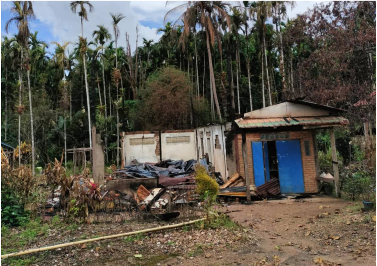
ภาพที่ 6: บ้านเรือนในหมู่บ้านพาร์ของถูกกองทัพเผาทำลาย เมื่อเดือนกันยายน 2025.