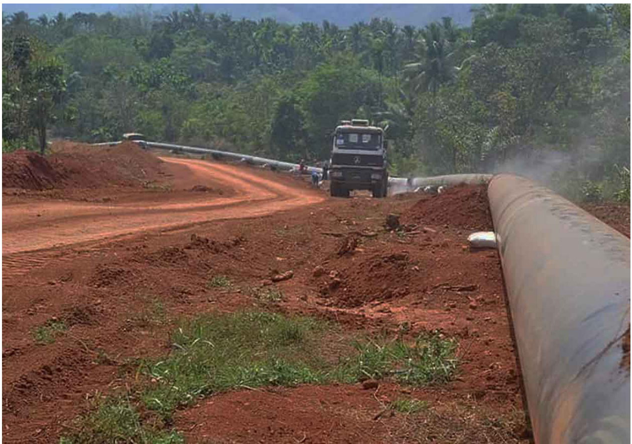
ภาพที่ 1: ท่อส่งก๊าซในพื้นที่กานเป้าก์ ถ่ายภาพเมื่อปี 2556.

เพื่อตอบโต้สถานการณ์ดังกล่าว ภาคประชาสังคมเมียนมาและการรณรงค์ระดับนานาชาติได้ระดมแรงกดดันต่อรัฐบาล บริษัท และสถาบันระหว่างประเทศ เพื่อเรียกร้องให้ตัดกระแสเงินไปยัง MOGE ความพยายามเหล่านี้มีส่วนผลักดันให้เกิดมาตรการคว่ำบาตรเฉพาะเป้าหมายและการถอนตัวของภาคธุรกิจ อย่างไรก็ตาม รายได้จากก๊าซยังคงเป็นหนึ่งในแหล่งเงินตราต่างประเทศที่สำคัญที่สุดที่หลงเหลืออยู่ของคณะเผด็จการทหาร โดยสรุป ภาคก๊าซนอกชายฝั่งของเมียนมายังคงเชื่อมโยงอย่างลึกซึ้งกับ การทำให้พื้นที่เป็นเขตทหาร ความเสี่ยงด้านสิทธิมนุษยชน และการปกครองแบบอำนาจนิยม หากไม่มีมาตรการควบคุมรายได้ กลไกความโปร่งใส และความรับผิดชอบของภาคธุรกิจอย่างมีประสิทธิภาพ รายได้จากก๊าซนอกชายฝั่งก็จะมีแนวโน้มจะยังทำหน้าที่เป็น กระดูกสันหลังทางการเงิน ที่ค้ำจุนการปกครองโดยทหารและความขัดแย้งในเมียนมาต่อไป