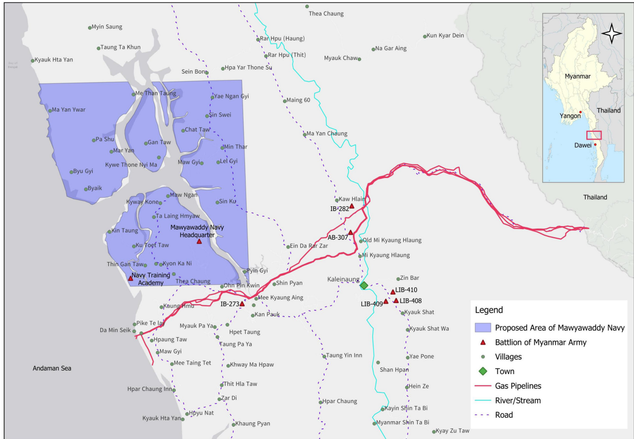
รูปที่ 3: แผนที่การยึดที่ดินของกองทัพเรือพร้อมแนวท่อก๊าซธรรมชาติ