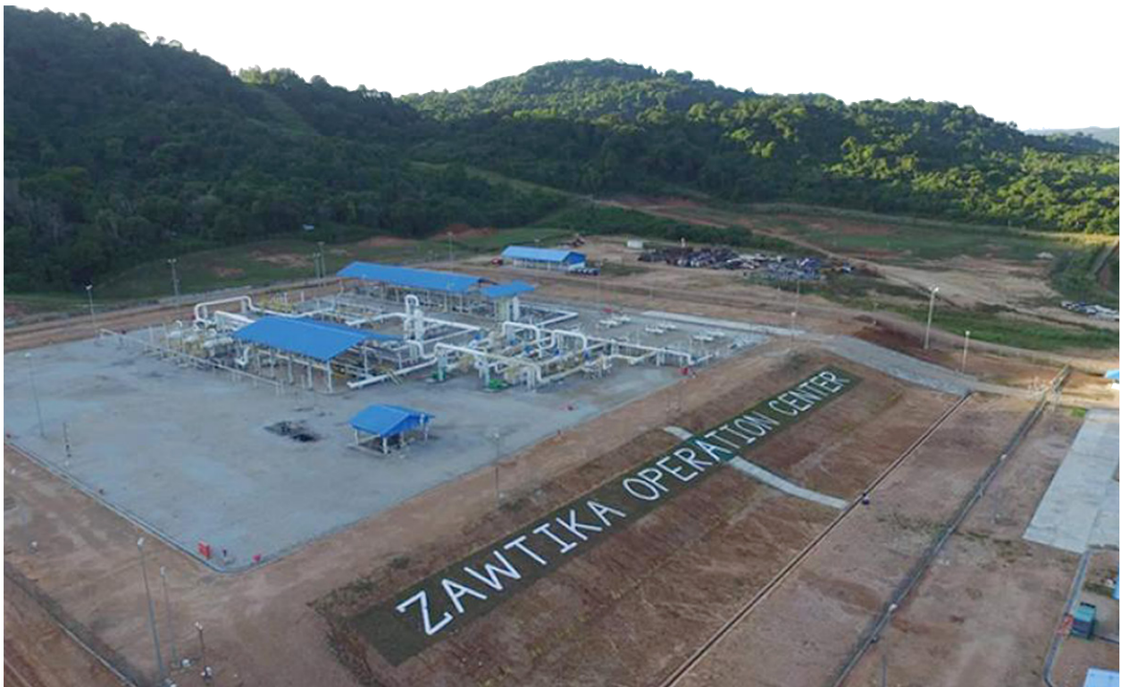
ภาพที่ 2: ภาพรวมศูนย์ปฏิบัติการแหล่งก๊าซซอติกา.