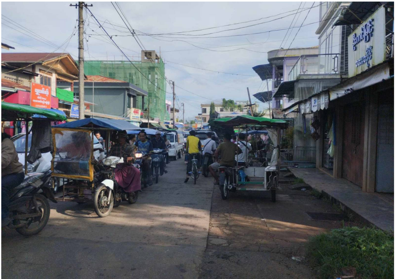
ภาพที่ 5: รถจักรยานยนต์สามล้อในหมู่บ้านกานเป่ากั ภายหลังการประกาศห้ามใช้รถจักรยานยนต์, ตุลาคม 2566.