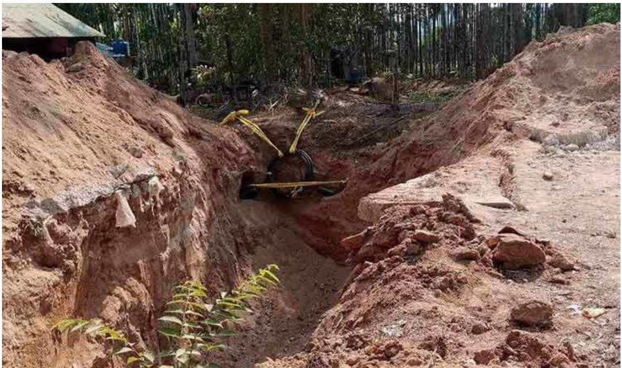
ภาพที่ 4: ถนนระหว่างกานเป้าก์และนาบูเล่ย์ถูกกองทัพเมียนมาทำลาย เมื่อเดือนเมษายน 2566.