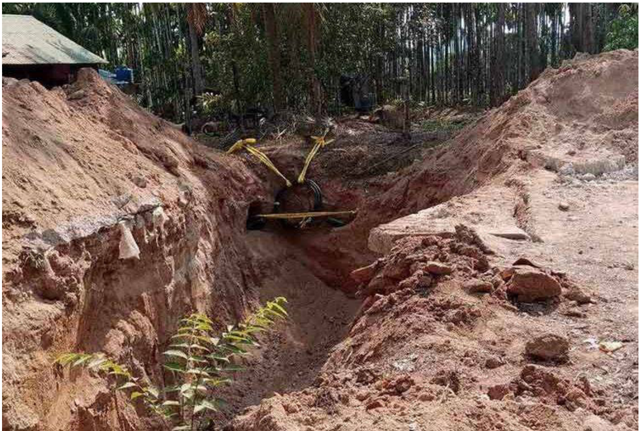
ပုံ - ၄ ) ၂၀၂၃ ခုနှစ်၊ ဧပြီလအတွင်း၊ ကံပေါက်နှင့် နဘုလယ် အကြားရှိ မြန်မာစစ်တပ်မှ ဖျက်ဆီးခဲ့သော လမ်းပိုင်း။