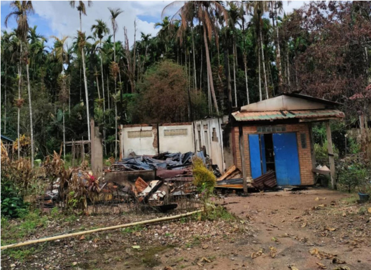
ပုံ - ၆ ) စစ်တပ်၏ မီးရှို့ဖျက်ဆီးခြင်း ခံခဲ့ရသော ဖားချောင်းကျေးရွာရှိ နေအိမ်များ၊ ၂၀၂၅ ခုနှစ်၊ စက်တင်ဘာလ။

(က) နေအိမ်များကို မီးရှို့ခြင်း - စစ်ကောင်စီတပ်ဖွဲ့များ ကျေးရွာများအတွင်းသို့ ဝင်ရောက်လာချိန်တွင် နေအိမ်များကို မီးရှို့ဖျက်ဆီးလေ့ရှိကြောင်း သတင်းပေးပို့ချက်များ မကြာခဏထွက်ပေါ်လျက်ရှိသည်။ စစ်တပ်က ကျေးရွာများအတွင်း ဝင်ရောက်တပ်စွဲပြီးနောက်တွင် ရွာလုံးကျွတ် မီးရှို့ခြင်းများ ပြုလုပ်ကြသည်။ ဖြစ်စဉ်တစ်ခုအနေဖြင့်၊ ၂၀၂၅ ခုနှစ် ဩဂုတ်လ ၂၄ ရက်နှင့် စက်တင်ဘာလ ၂ ရက်နေ့ကြားတွင် ရေဖြူမြို့နယ်၊ ဖားချောင်းကျေးရွာအုပ်စု၊ တောင်ရင်းအင်းကျေးရွာ၌ စစ်တပ်ကတပ်စွဲထားစဉ်အတွင်း နေအိမ် ၂၀ ခန့်ကို မီးရှို့ဖျက်ဆီးခဲ့သည်။ ရွာသားတစ်ဦး၏ ပြောကြားချက်အရ “ဘုန်းကြီးကျောင်းမှာ သိမ်းထားတဲ့ ဆိုင်ကယ်တွေကိုလည်း စစ်သားတွေက အင်ဂျင်ပိုင်တွေဖောက်ထုတ်ပြီး အင်ဂျင်ထဲကို သဲတွေထည့်ကာ တမင် တကာ ပျက်စီးအောင် လုပ်သွားကြတယ်” ဟုသိရသည်။