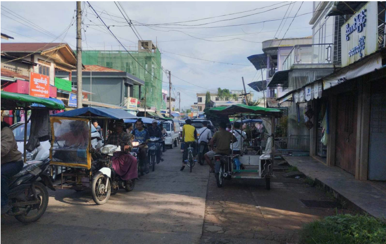
ပုံ - ၅ ) ဆိုင်ကယ်စီးနင်းခွင့် ပိတ်ပင်ပြီးနောက် ကံပေါက်ကျေးရွာတွင် အသုံးပြုနေကြသည့် သုံးဘီး ဆိုင်ကယ်များ၊ ၂၀၂၃ ခုနှစ်၊ အောက်တိုဘာလ။

လေ့ကျင့်ပေးပြီး လက်နက်တပ်ဆင်ပေးထားသော ပျူစောထီးပြည်သူ့စစ်များက စစ်သားများ၊ ရဲများနှင့်အတူ ပူးပေါင်းလုပ်ဆောင်နေကြသည်။ အဆိုပါစစ်ဆေးရေးဂိတ်များတွင်၊ မော်တော်ယာဉ်များကို ရပ်တန့်စေကာ ဖုန်းနှင့် အိတ်များကို စစ်ဆေးလေ့ရှိသည်။ ထို့အပြင်၊ ရှောင်တခင် စစ်ဆေးရေးဂိတ်များမှာလည်း ပုံမှန်ဖြစ်ရိုးဖြစ်စဉ်လို ဖြစ်နေသည်။ မိုဘိုင်းဖုန်းများအတွင်းမှ သံသယဖြစ်ဖွယ် ဓာတ်ပုံများ သို့မဟုတ် မက်ဆေ့များတွေ့ရှိသည်ဟုဆိုကာ ဖမ်းဆီးမှုများရှိနေကြောင်း သတင်းပေးပို့ချက်များ အရသိရသည်။ ရွာသားများသည် ၎င်းတို့၏ ဥယျာဉ်ခြံမြေများသို့ သွားရောက်ရန်အတွက်ပင် “ခွင့်ပြုမိန့်လက်မှတ်” များ ရယူနေရသဖြင့် သွားလာခွင့်မှာ ပိုမိုကန့်သတ်ခံထားရသကဲ့သို့ ဖြစ်နေသည်။ စစ်ဆေးရေးဂိတ်များကို လူသားချင်းစာနာထောက်ထားမှုဆိုင်ရာ အကူအညီများပေးပို့မှုကို ကန့်သတ်ရန်အတွက်လည်း အသုံးပြုနေကြသဖြင့်၊ မရှိမဖြစ်လိုအပ်သော အကူအညီများကိုရယူနိုင်ရန် ခက်ခဲစေသည်။ ကံပေါက်ဒေသမှ ယာဉ်မောင်းတစ်ဦးက “စစ်ဆေးရေးဂိတ်တွေကြားမှာ ညှိနှိုင်းဆောင်ရွက်မှု ဒါမှမဟုတ် တပြေးညီသတ်မှတ်ချက်ဆိုတာ မရှိဘူး။ တချို့ဖြစ်စဉ်တွေမှာ၊ ဂိတ်တစ်ခုက ဆန်သယ်တာကို ခွင့်ပြုပေးပေမဲ့ နောက်ထပ်ဂိတ်တစ်ခုကျတော့ အဲဒီဆန်တွေကို သယ်ခွင့်မပေးဘဲ သိမ်းယူလိုက်တာ မျိုးတွေရှိတယ်” ဟုဆိုသည်။ မကြာသေးမီက ထွက်ပေါ်လာသော အစီရင်ခံစာများအရ၊ ကလိန်အောင်လမ်းပေါ်တွင် စစ်ဆေးရေးဂိတ် နှစ်ခု၊ သဲချောင်း၊ ဖောင်းတောနှင့် မင်းသားကျေးရွာအုပ်စုများတွင် ပျူစောထီးစစ်ဆေးရေးဂိတ်သုံးခုနှင့် ပယကျေးရွာတွင် ရေတပ်စစ်ဆေးရေးဂိတ်တစ်ခုတို့ရှိနေပြီး ယင်းတို့မှာ ဒေသခံ PDF များ၏ လှုပ်ရှားမှုကို ကန့်သတ်ရန်ရည်ရွယ်ခြင်း ဖြစ်ကြောင်း သိရသည်။