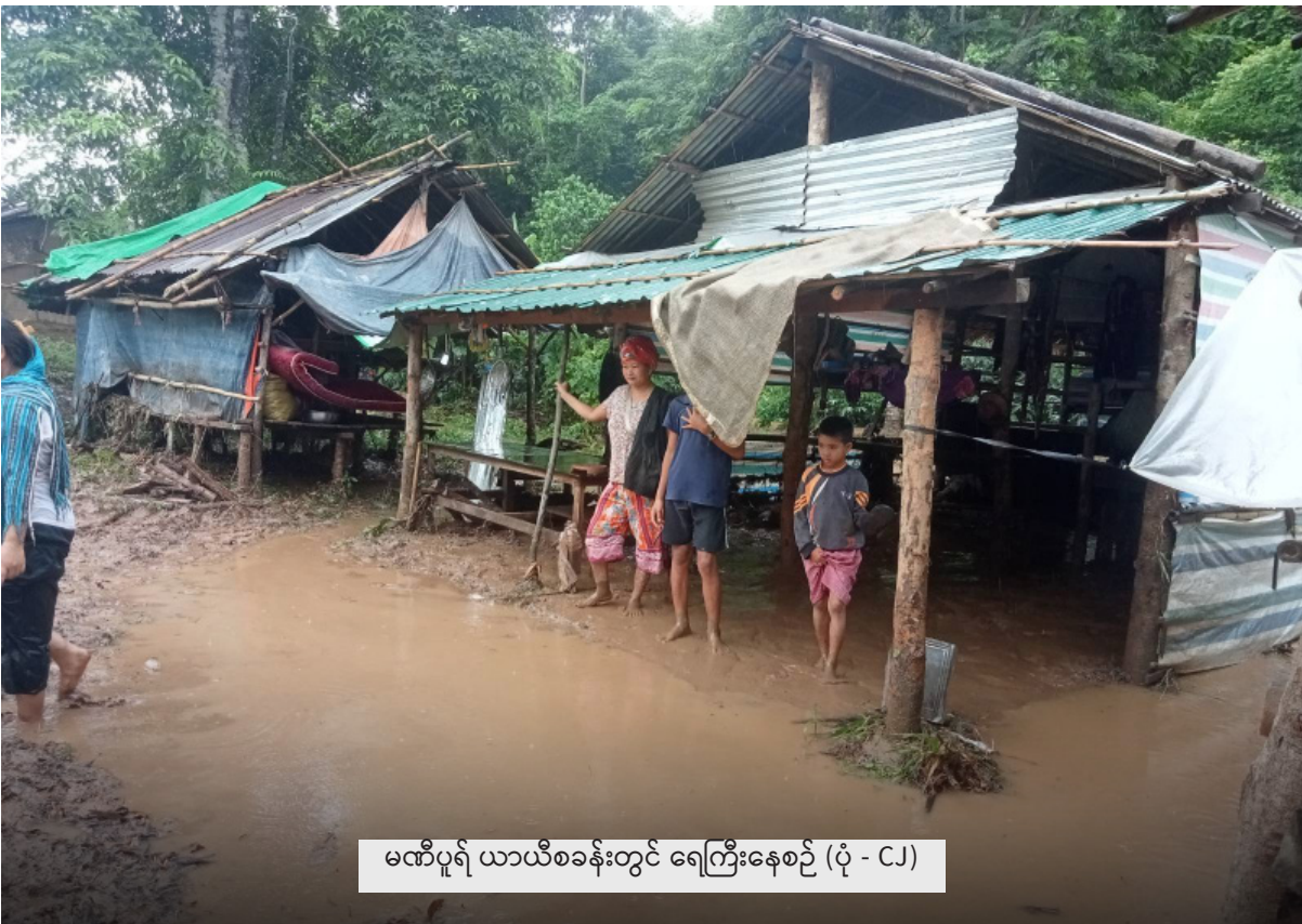
မထိပူရ် ယာယီစခန်းတွင် ရေကြီးနေစဉ်

အထက်ဖော်ပြပါ ခက်ခဲကြမ်းတမ်းသော ထောင်တွင်းအခြေအနေများအပြင် ဖမ်းဆီးခံထားရသော မြန်မာဒုက္ခသည်များအတွက် နောက်ထပ်ကြီးမားသော စိန်ခေါ်မှုတစ်ခုမှာ ပြန်လည်လွတ်မြောက်လာသည့်အခါတွင်လည်း လုံခြုံရာသို့ မသွားနိုင်ပဲ အကြမ်းဖက်စစ်အုပ်စုထံ အပ်နှံခံရနိုင်သည့် အန္တရာယ်ဖြစ်သည်။ ဆက်လက်ဖမ်းဆီးချုပ်နှောင်ခံထားရသူ အားလုံးနီးပါးသည် အာဏာသိမ်းမှုနောက်ပိုင်း အဖမ်းခံခံရသူများဖြစ်ပြီး အကြမ်းဖက်စစ်အုပ်စုထံ လွှဲပြောင်းခံရပါက အချိန်မရွေး ပြင်းထန်စွာနှိပ်စက်ခြင်း၊ သတ်ဖြတ်ခြင်း၊ စစ်မှုထမ်းအဖြစ် အဓမ္မခိုင်းစေခြင်းနှင့် နှစ်ရှည်ထောင်ဒဏ်များ ချမှတ်အရေးယူခြင်း ခံရနိုင်ခြေရှိသူများ အများအပြား ပါဝင်နေသည်။ ထို့ကြောင့် မထိပူရ်ထောင်တွင် ဖမ်းဆီးထိန်းသိမ်း ခံသူများသည် ဤသို့ဆိုးရွားလှသော အခြေအနေမှ လွတ်မြောက်နိုင်ရေးအတွက် ၂၀၂၃ ခုနှစ်၊ ဒီဇင်ဘာလ၊ ၁၆ ရက်နေ့မှ ၂၀ ရက်နေ့အထိ တစ်ကြိမ်၊ ၂၀၂၄ ခုနှစ်၊ ဇွန်လ (၁၆) ရက်နေ့မှ ဇူလိုင်လ (၃) ရက်နေ့အထိ တစ်ကြိမ်၊ ၂၀၂၄ ခုနှစ်၊ ဇူလိုင်လ (၂၀) ရက်နေ့မှ (၂၄) ရက်နေ့အထိ တစ်ကြိမ်၊ ဩဂုတ်လ (၂၆) ရက်နေ့မှ (၃၀) ရက်နေ့အထိတစ်ကြိမ် စုစုပေါင်း (၄) ကြိမ်တိုင်တိုင် အစာငတ်ခံဆန္ဒပြကာ အမြန်ဆုံးပြန်လည် လွတ်မြောက်နိုင်ရေး တောင်းဆိုမှုများ ပြုလုပ်ခဲ့ကြသည်။