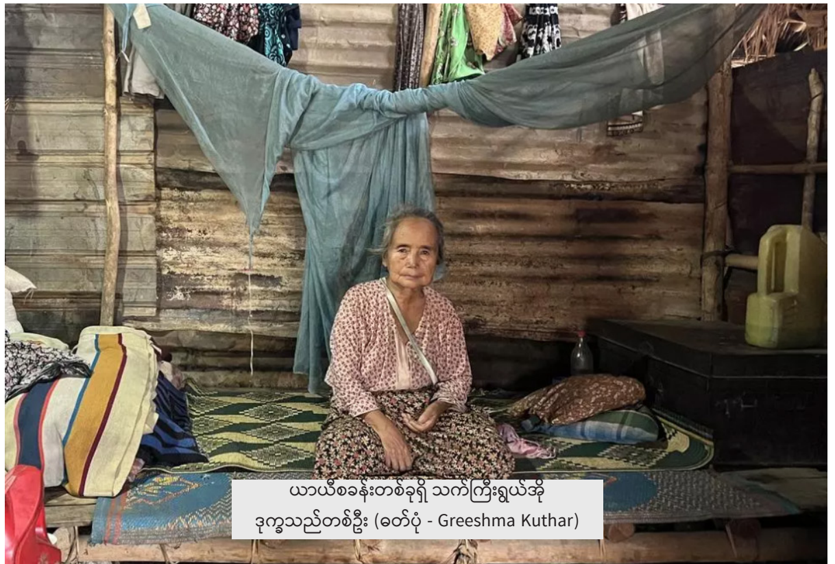
ယာယီစခန်းတစ်ခုရှိ သက်ကြီးရွယ်အို ဒုက္ခသည်တစ်ဦး