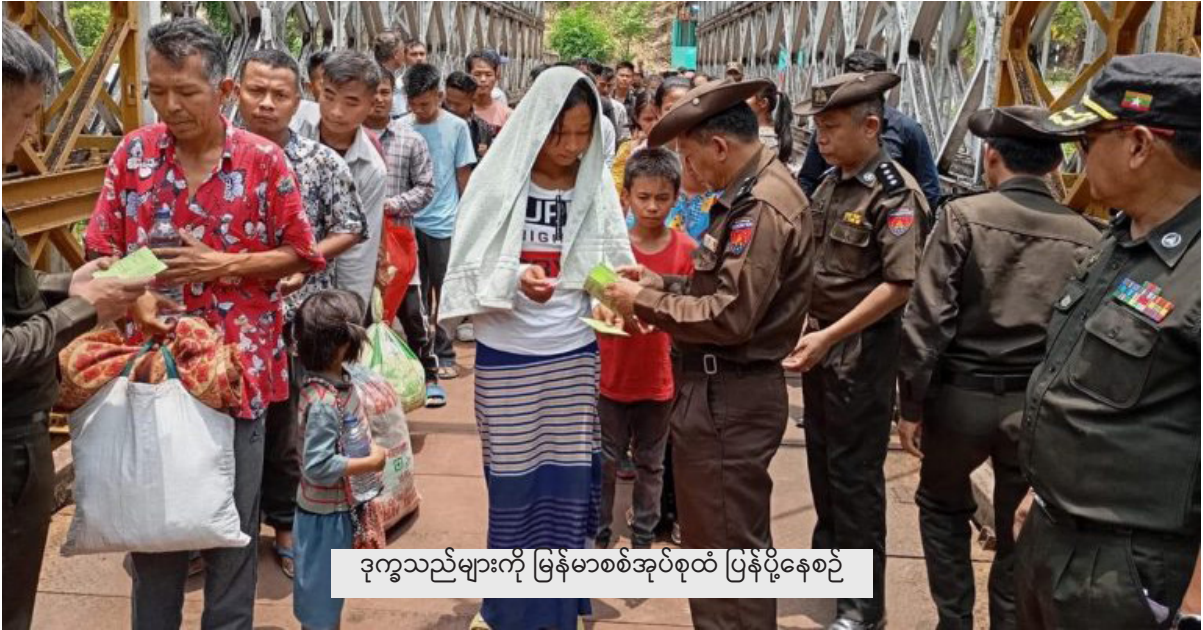
ဒုက္ခသည်များကို မြန်မာစစ်အုပ်စုထံ ပြန်ပို့နေစဉ်