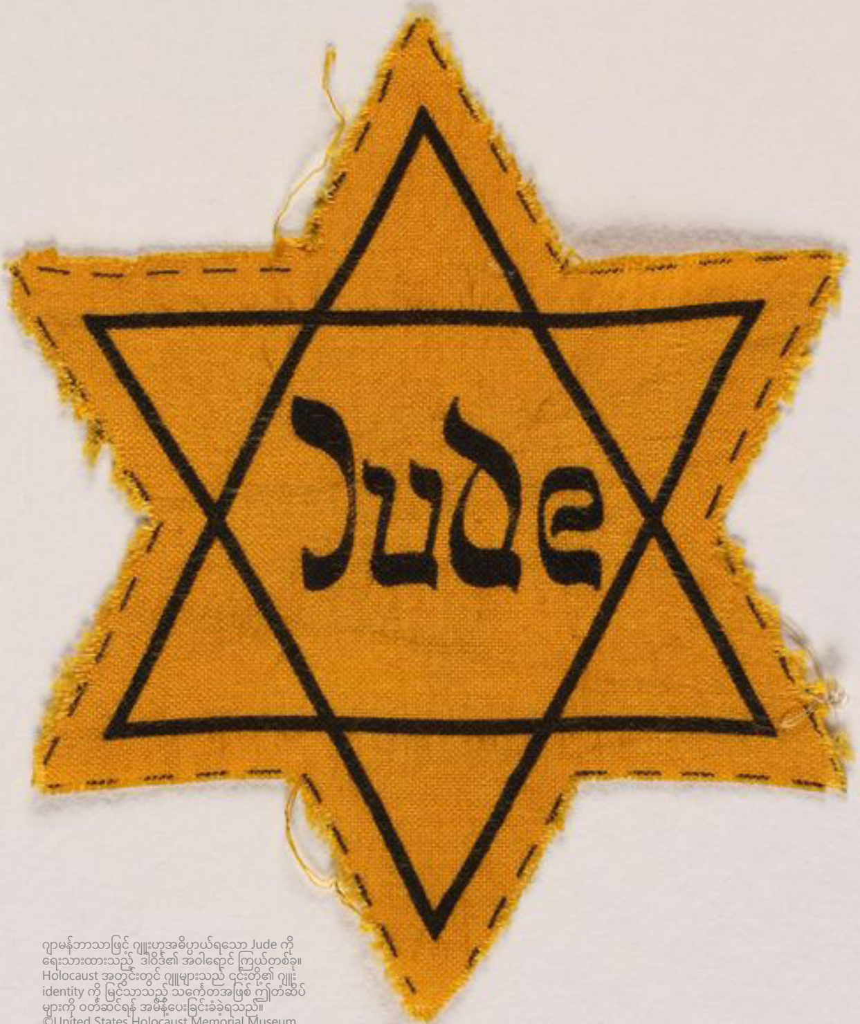
ဂျပန်ဘာသာဖြင့် ဂျူးဟုအဓိပ္ပာယ်ရသော Jude ကို ရေးသားထားသည့် ဒါရိဒ်၏ အဝါရောင် ကြယ်တစ်ခု။ Holocaust အတွင်းတွင် ဂျူးများသည် ၎င်းတို့၏ ဂျူး identity ကို မြင်သာသည့် သင်္ကေတအဖြစ် ကြိုက်ဆပ် များကို ဝတ်ဆင်ရန် အမိန့်ပေးခြင်းခံခဲ့ရသည်။