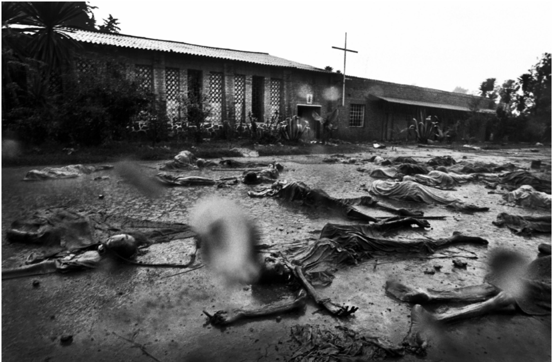
၁၉၉၄ ခုနှစ် ရုဝန်ဒါနိုင်ငံ Rukara ရှိ ကတ်သလစ် ဘုရားကျောင်း အပြင်ဖက်တွင် ကျန်ရစ်ခဲ့သော အစုလိုက်အပြုံလိုက်အသတ်ခံခဲ့ရသည့် တူဆီ လူမျိုးများ၏ ပုပ်သိုးပျက်စီးနေသော အလောင်းများ။