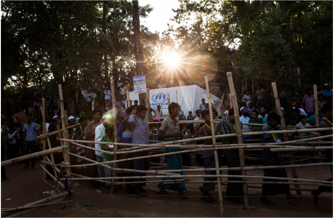
ဘင်္ဂလားဒေ့ရှ်နိုင်ငံ Cox's Bazar ခရိုင်၊ Balukhali စခန်းရှိ အကူအညီပစ္စည်းများဖြန့်ဝေရာ နေရာတွင် တန်းစီနေသော ရိုဟင်ဂျာ ဒုက္ခသည်များ။