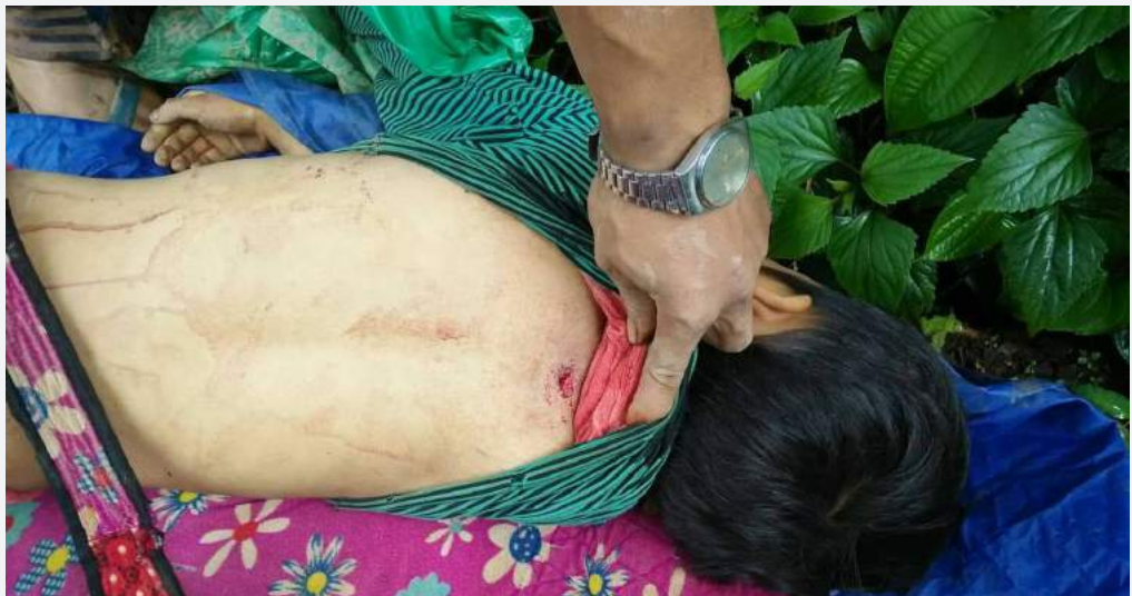
လက်နက်ကြီးဒဏ်ရာကြောင့်သေဆုံးသွားသောကလေးငယ်ပုံ၊ ရှမ်းပြည်နယ်မြောက်ပိုင်း၊ကွတ်ခိုင်၊ (ခတ်ပုံ - TWO)

အစိုးရစစ်တပ် တပ်မ (၈၈) မှ ၂၀၁၈ ခုနှစ် ဇွန်လ ၂၈ ရက် နံနက်စောစောတွင် ရှမ်းပြည် မြောက်ပိုင်းမူဆယ်ခရိုင်ကွတ်ခိုင်မြို့နယ် - - - - -ကျေးရွာတွင်တပ်စွဲထားသည့်တအာင်းအမျိုးသား လွတ်မြောက်ရေး တပ်မတော် TNLA ကို လက်နက်ကြီးဖြင့် ပစ်ခတ်ခဲ့ခြင်းဖြစ်သည်။ ရွာသားတဦးမှ “ဗမာတပ်ဘက်ကစပြီး ဘုန်းကြီးကျောင်း အထက်ကနေလက်နက်ကြီးတွေနဲ့ အရင်ပစ်တာ။ အိမ် တွေလည်းထိတယ်။ ပြီးတော့ ဗမာစစ်တပ်က ဆိုင်ကယ်၊ ကားတွေခေါ်ပြီး ဒဏ်ရာရတဲ့သူတွေကို ကွတ်ခိုင်မှာရှိတဲ့ တပ်ဆေးရုံကို ပို့လိုက်တယ်။ ဒဏ်ရာတွေ အရမ်းပြင်းထန်တယ်၊ ရွာသားတွေလည်း အရမ်းကြောက်နေကြတယ်” ဟုပြောသည်။