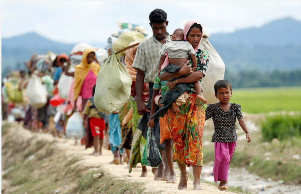
ရိုဟင်ဂျာဒုက္ခသည်များ မြန်မာနိုင်ငံမှ နေဘင်္ဂလားဒေ့ရှ်ဒုက္ခသည်စခန်းသို့သွားလာနေပုံ။

လူ့အခွင့်အရေးချိုးဖောက်မှုများကို စုံစမ်းဖော်ထုတ်ရန် ကုလသမဂ္ဂမှ ဖွဲ့စည်းပေးထားသည့် အချက်အလက် ရှာဖွေရေးကော်မရှင်ကဲ့သို့ပင် ယန်ဟီလီးမှာလည်း တိုင်းပြည်သို့ ဝင်ရောက်ခွင့်ကို ပိတ်ပင်ခံထားရသည်။ လူ့အခွင့်အရေးချိုးဖောက်မှုများကို စုံစမ်းစစ်ဆေးရန်ပြည်တွင်းမှအဖွဲ့ဝင် ၂ ဦးနှင့် ပြည်ပမှ အဖွဲ့ဝင် ၂ ဦး ပါဝင် ဖွဲ့စည်းထားသည့် နိုင်ငံတကာ ကော်မရှင်တရပ်ကို အစိုးရမှ ဖွဲ့စည်းခဲ့သည်။ အလားတူ ယခင်ကဖွဲ့စည်းခဲ့သည့် ကော်မရှင်များသည် စစ်သားများ ကျူးလွန်သည့်လုပ်ရပ်များအပေါ် အရေးမယူဘဲ ဖြေလျော့ပေးခဲ့ကြသည်။ ၃၁