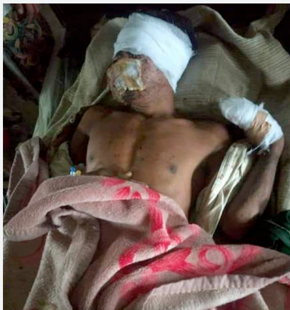
မြေမြှုပ်မိုင်းကြောင့် ဒဏ်ရာရရှိသူတစ်ဦး၊ ပလက်ဝ၊ ချင်းပြည်နယ်။

ကြူ.....ရွာမှ မိနစ် ၃၀ ခန့် လမ်းလျှောက်ရသည့် ကေ.....ရွာအနီးတွင် မိုင်းနင်းမိပြီး ၂၈ နှစ် အရွယ် အမျိုးသမီးတစ်ဦး သေဆုံးကာ ၁၈ နှစ်အရွယ် အမျိုးသမီးတစ်ဦး ဒဏ်ရာရသွားသည်။ ၂၀၁၈ ခုနှစ် အောက်တိုဘာ ၂၃ ရက် တွင်လည်း ပလက်ဝမြို့နယ်တွင် ၃၅ နှစ်အရွယ် အမျိုးသားတဦး မိုင်းနင်းမိပြီး ခြေထောက်တွင် ဒဏ်ရာပြင်းထန်စွာ ရရှိသွားသည်။ ရွာသားများ သည် မိုင်းနင်းမိမည်စိုး၍ တောတွင်းသို့ရှောင် ကွင်းသွားလာကြရသည်။ ရခိုင်တပ်မတော် အနေဖြင့် အဆိုပါဒေသတွင် လှုပ်ရှား သွားလာနေသော်လည်း မည်သူထောင်သည့်မိုင်းဖြစ်သည်ကို မည်သူမျှ အတိအကျ မပြောနိုင်ကြချေ။