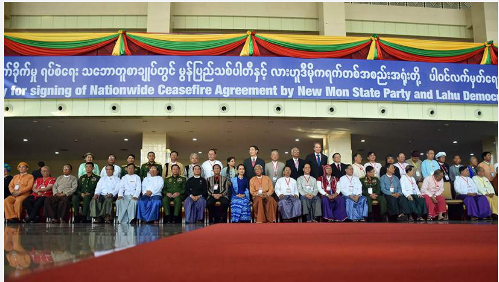
ပစ်ခတ်တိုက်ခိုက်မှု ရပ်စဲရေး သဘောတူစာချုပ် လက်မှတ်ရေးထိုးအခမ်းအနား နေပြည်တော်၊ မတ်လ

အောက်တိုဘာလတွင် အစိုးရနှင့် NCA လက်မှတ်ရေးထိုးထားသည့် EAOs များ ၂ ရက်ကြာ တွေ့ဆုံပြီး စေ့စပ်ဆွေးနွေးပွဲများတွင် သဘောတူညီမှုမရသေးသည့် အဓိကအချက် ၂ ချက်ဖြစ်သည့် ပြည်ထောင်စုမှ မခွဲထွက်ရေးနှင့် တစ်ခုတည်းသော တပ်မတော်ဖွဲ့စည်းရေးအတွက် ဆွေးနွေးရန် လမ်းညွှန်ချက်များ ချမှတ်ခဲ့သည်။ ၄ ကြိမ်မြောက် ၂၁ ရာစု ပင်လုံညီလာခံကို ၂၀၁၉ ခုနှစ် အစောပိုင်းတွင် ကျင်းပရန် သဘောတူကြသည်။